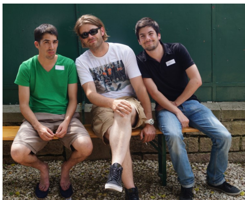
Les plus jeunes