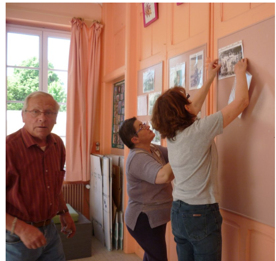
De nombreuses photos en exposition.